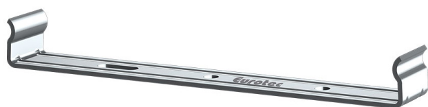
CLIP DRAIN TEC